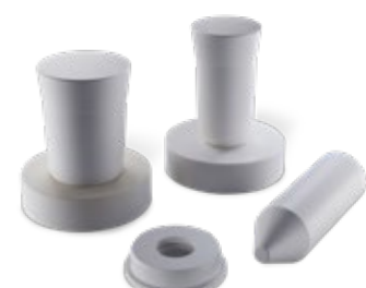
Stopfen / Platten