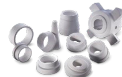
Düsen / Buchsen