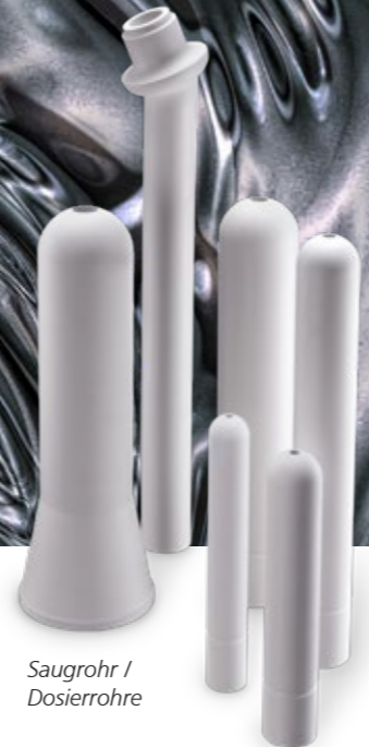
Saugrohr / Dosierrohre